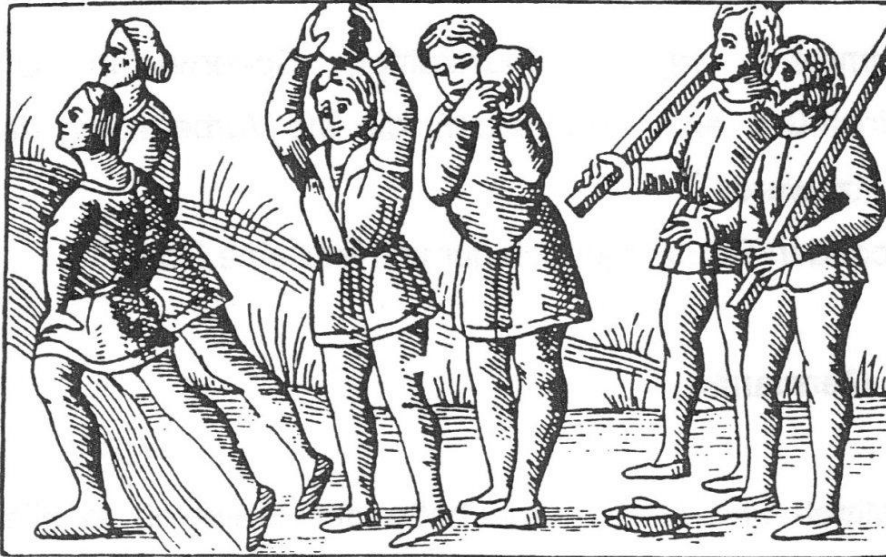
Abbildung 5:Steinstoßer im Mittelalter

daß das einfache Volk seine gewöhnlichen Tätigkeiten nicht auf das damals wertvolle Papier aufzeichnete. 8